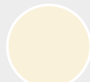
Blanc crème RAL 9001