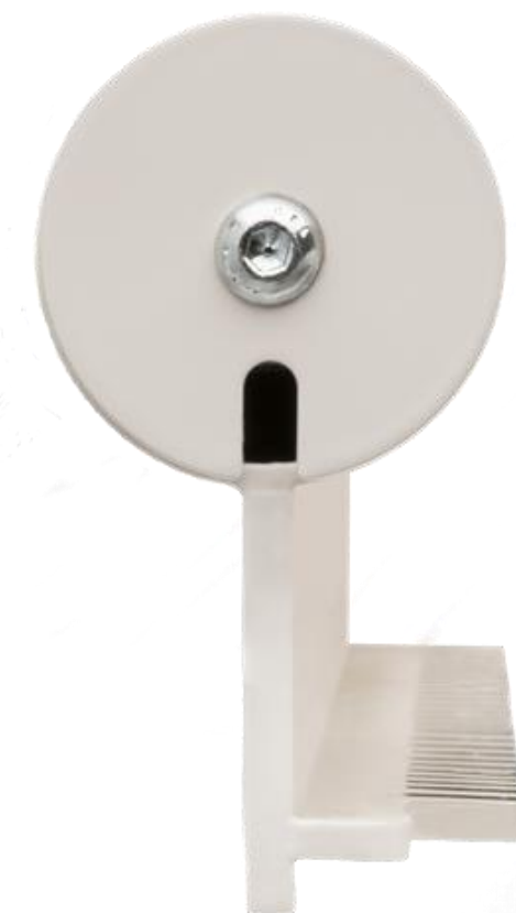
Otolift Modul-Air Smart

Teste avec une charge de 800 kg Le rail modulaire est tellement solide que nous l'avons charge jusqu'a 800 kg pendant les essais. Telle est la qualite Otolift.